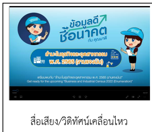
สื่อเสียง/วิดีโอทัศน์เคลื่อนไหว